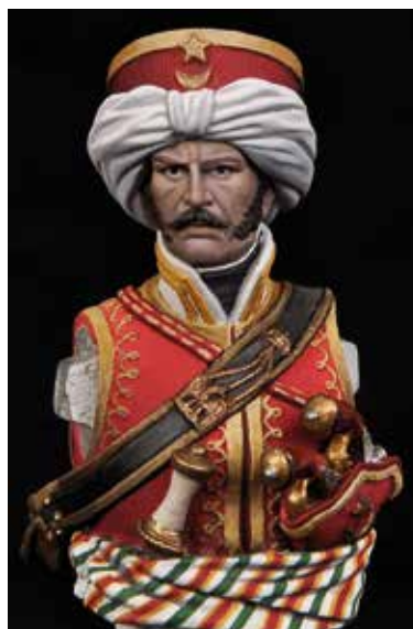
38 39 Vistas del torso con todos los detalles finalizados.