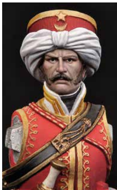
37 Pintura de los detalles finales de la cara.