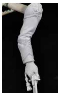
37 Las sombras de las mangas se pintaron con aerógrafo, respetando el blanco de la imprimación. La mezcla fue nº 3 del set para "metal no metálico" ACS-12 con azul ultramarino 27-XNAC.