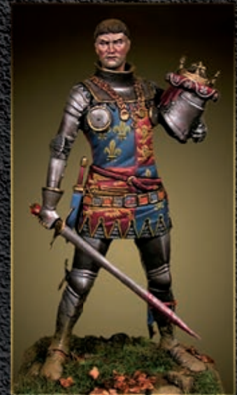
Sir Edmund de Thorpe