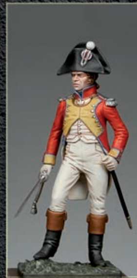
Officier du 1er régiment suisse 1805