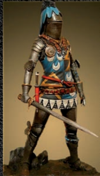
Henry V d'Angleterre