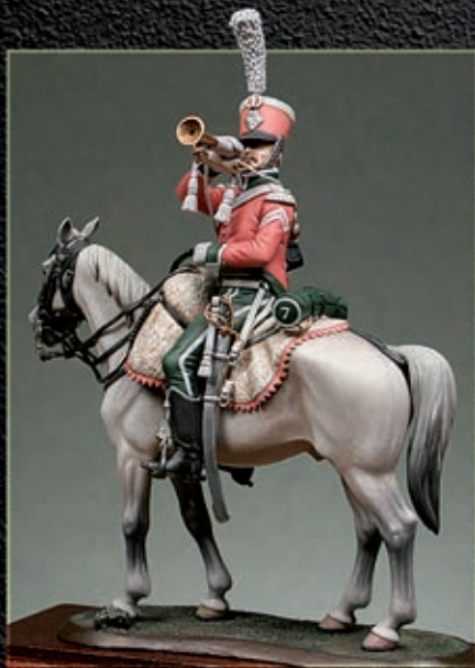
Trompette du 7ème régiment de chasseurs. Compagnie d'élite.