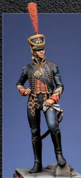
Quartier maître des marins de la Garde