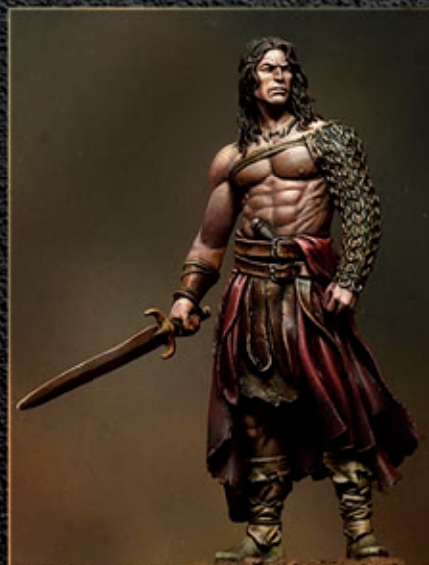
Barbarian of Draco